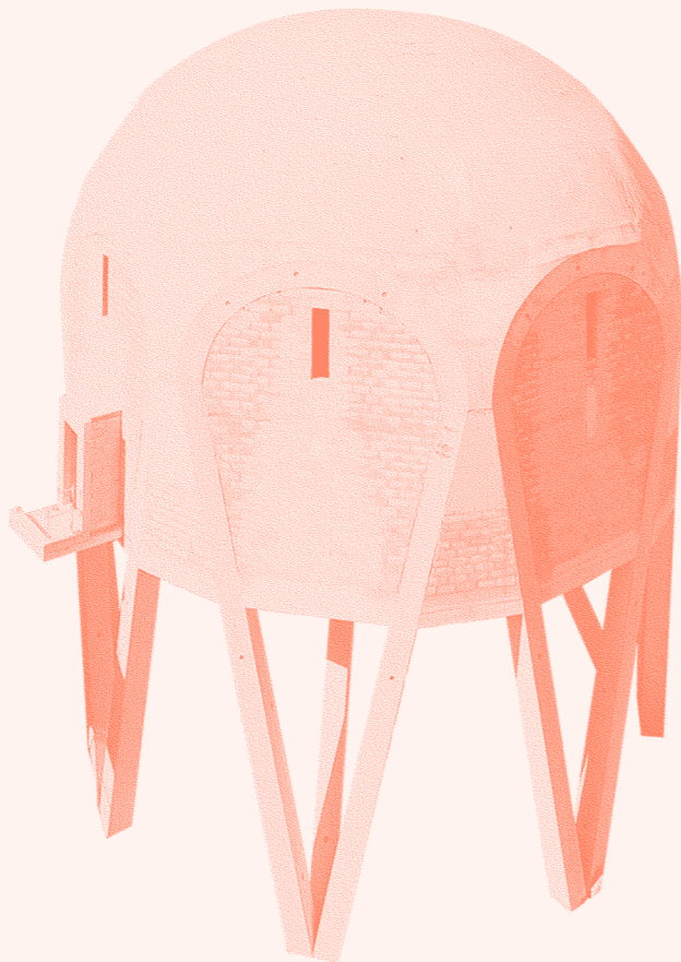
Le Module Friche la Belle de Mai