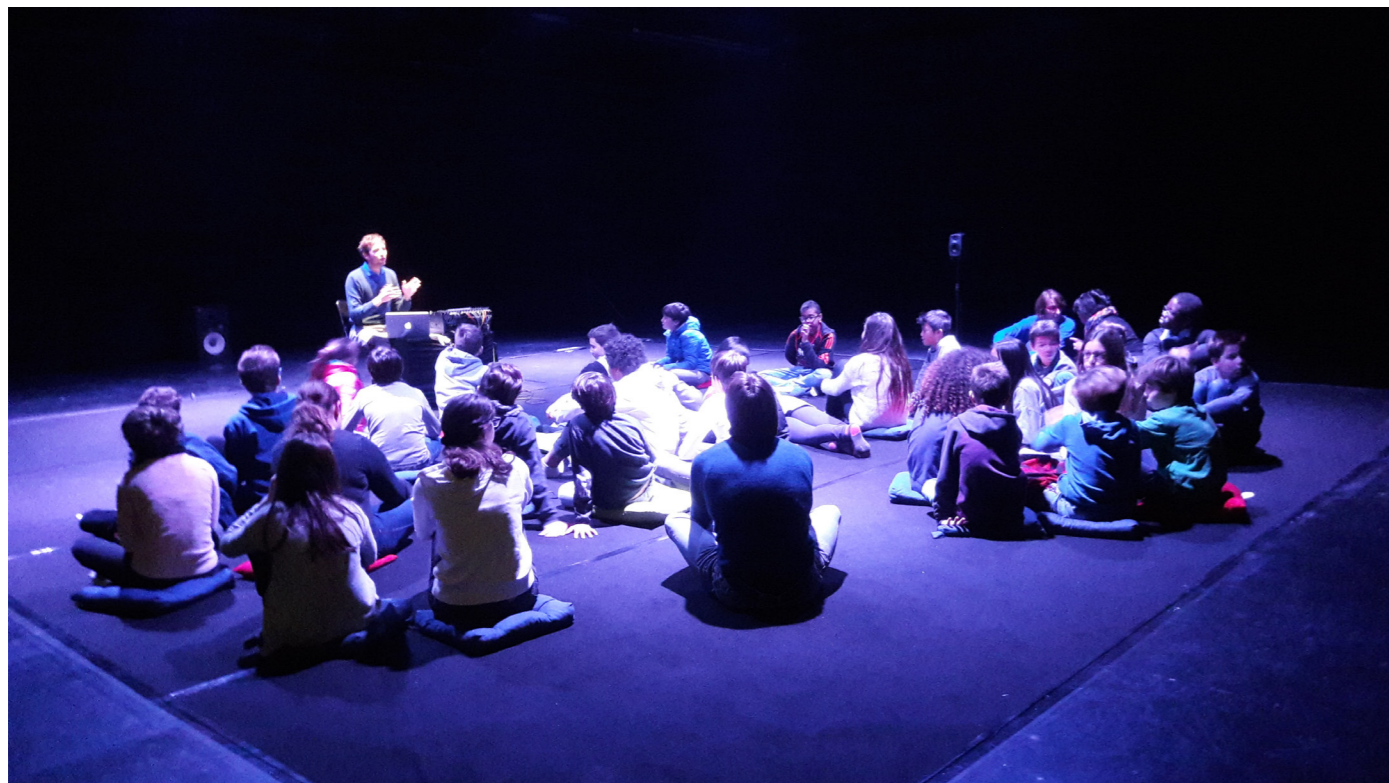
Écoutes commentées organisées en 2017, avec le compositeur Sébastien Roux

Les écoutes commentées sont des moments de rencontre et de partage avec un artiste associé au GMEM : une belle occasion de découvrir, dans des conditions originales, des univers artistiques singuliers et exigeants.