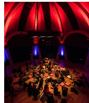
Séance d'Écoutes Commentées avec un.e compositeur·rice associé.e au GMEM

Durée : 3h Période : novembre Tarif : 160€