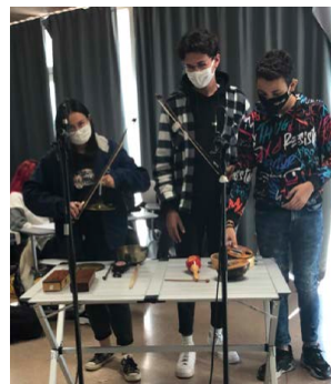
Actions supplémentaires possibles (en totalité ou au choix) Atelier Découverte des musiques électroacoustique

Durée : environ 20h d'ateliers Période : à définir (généralement entre janvier et juin) Tarifs : Budget prévisionnel sur demande / demande de financements INES possibles