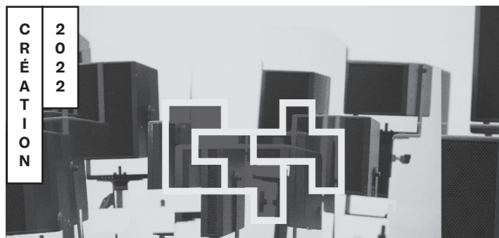
© P.Gondard / C.Bascou / P. Pulisciano