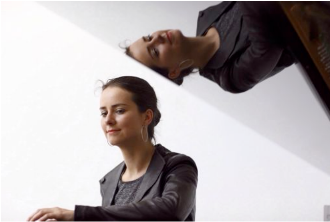
© Alberto Novelli - Villa Massimo