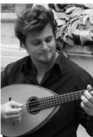
Vincent Beer Demander Mandoline